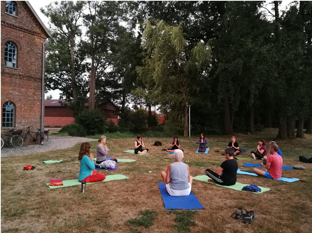
Die schönen Sommerwochen für Yoga an der Süstedter Wassermühle genutzt.